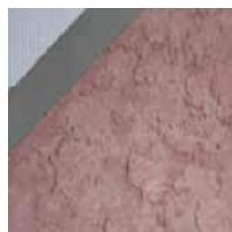
10442 スパイスサンセット * 国内在庫品