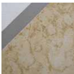
10411 カシミア * 国内在庫品