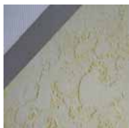
10421 クラシッククリーム