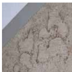
10423 ブラッシュウッド